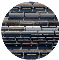
Kuljetus ja logistiikka