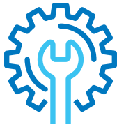
Varaosat ja huolto