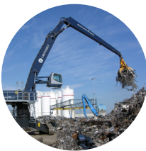
Jätteenkäsittely ja kierrätys