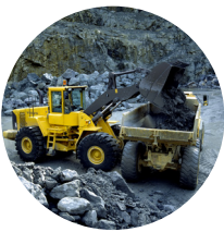
Maanrakennus ja kaivokset