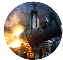
Prosessi- ja valmistava teollisuus